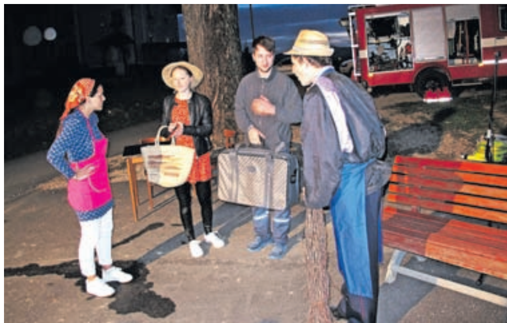
Skeč Korona so izvedli člani KUD Pod lipo Adergas.

vanje gasilcev v primeru požara. Na prireditvi so se pripeljali z dvema gasilskima voziloma. Prireditev je domiselno povezovala Angelca Maček, ki je predstavila domačijo Pr' Tratarju ter letošnje goste, člane PGD Velesovo. Na ogled je bila tudi razstava