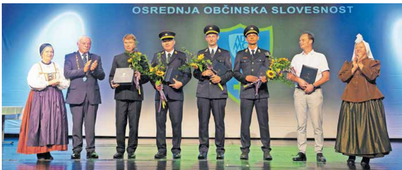
V Cerkljah so letos podelili veliko in malo plaketo ter štiri priznanja občine.