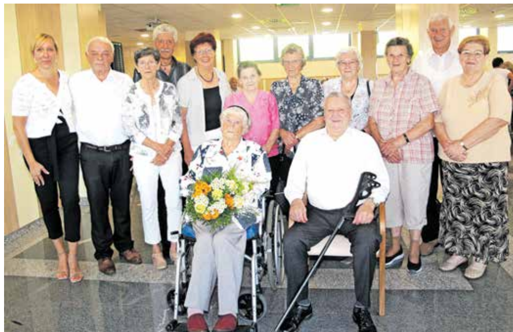
Slavljenka ob praznovanju stotega rojstnega dne