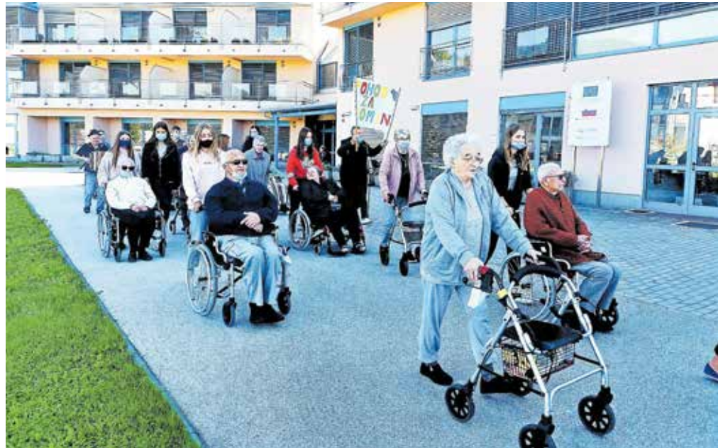
Na Sprehodu za spomin ob dnevu Alzheimerjeve bolezni

Pohoda so se poleg stanovalcev doma udeležili tudi zaposleni in učenci OŠ Davorin-