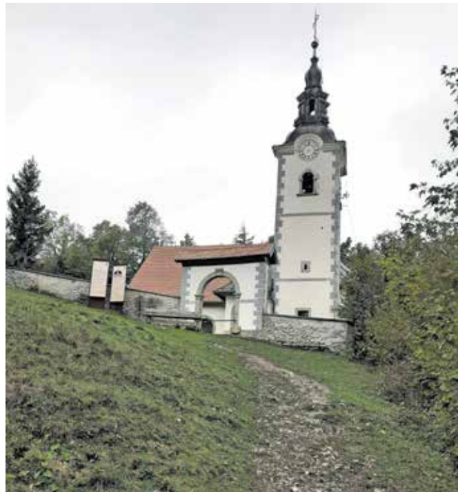
Štefanjska cerkev