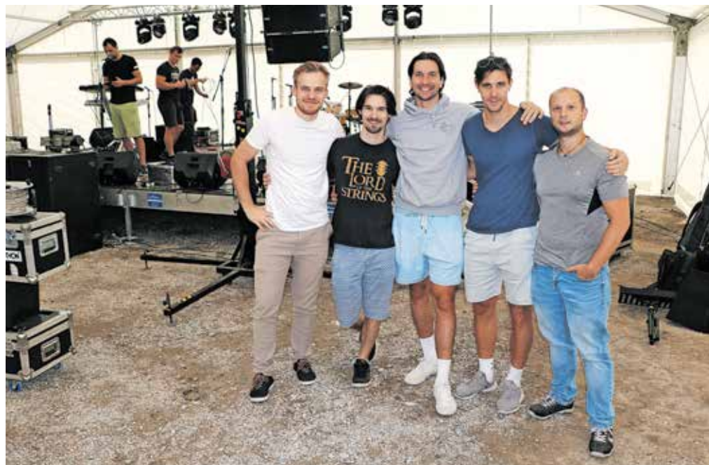
Posebni gostje pred nastopom