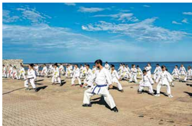
Trening na letni šoli karateja za otroke

V oktobru imamo v Karate klubu Cerklje odprta vrata za vse, ki želijo spoznati sankukai karate. Cicibani (predšolski otroci in učenci 1. razreda) se nam lahko pridružijo ob torkih 17.00–17.45, šolarji (učenci 2.–9. razreda) ob torkih 17.45–18.30 in ob četrkih 17.00–17.45. Naše dejavnosti potekajo v mali telovadnici z ogledali v Športni dvorani Cerklje.