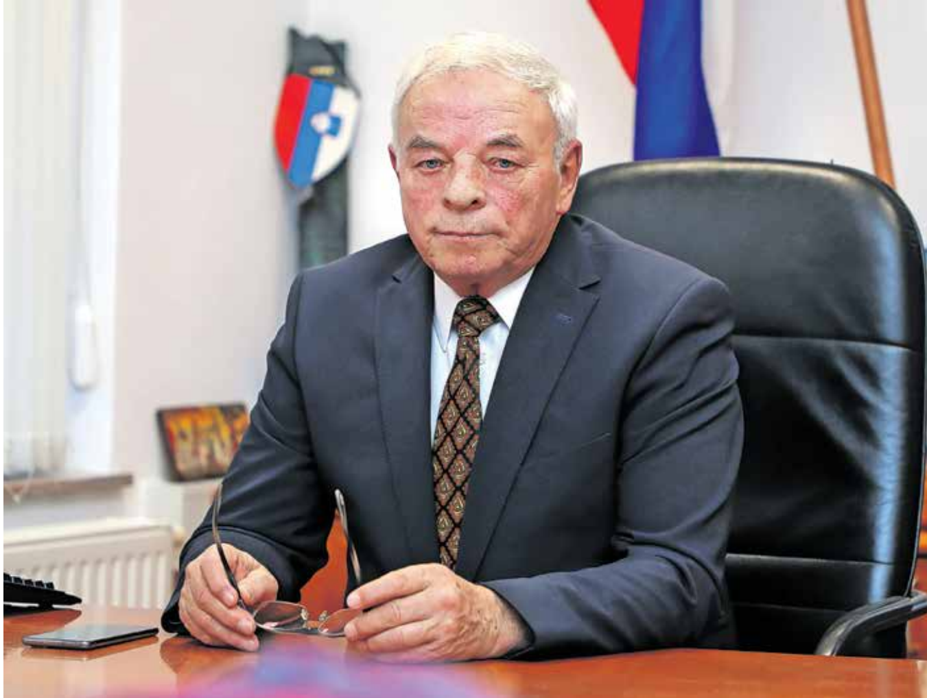
Župan Franc Čebulj

Nujen je bil predvsem zaradi visokih cen gradbenih materialov, zaradi katerih je bilo treba uskladiti pogodbe z nekaterimi izvajalci del. Predvsem gre za projekte izgradnje kanalizacije in vodo-