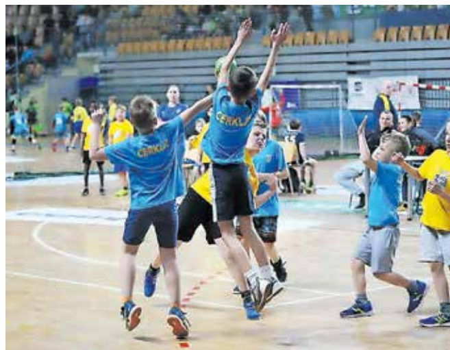
Mladi rokometišči že trenirajo.

Cerklje – V Rokometnem klubu Cerklje vemo, da so za naš osebni in telesni razvoj zelo pomembni gibanje in izkušnje, ki jih v mladosti pridobimo skozi proces učenja in delovanja v timu. Zavedamo se svoje odgovornosti, zato želimo v čim večji meri to tudi upravičiti. Naše treninge vodijo izšolani trenerji z licencami, ki so vsi tudi nekdanji igralci rokometu. Mladim tako z uspešnim delom zagotavljamo igranje na najvišji ravni in jih pri njihovem napredku tudi individualno obravnavamo. Naš namen je navdušiti otroke nad rokometno igro, jih spodbuditi k rednemu gi-