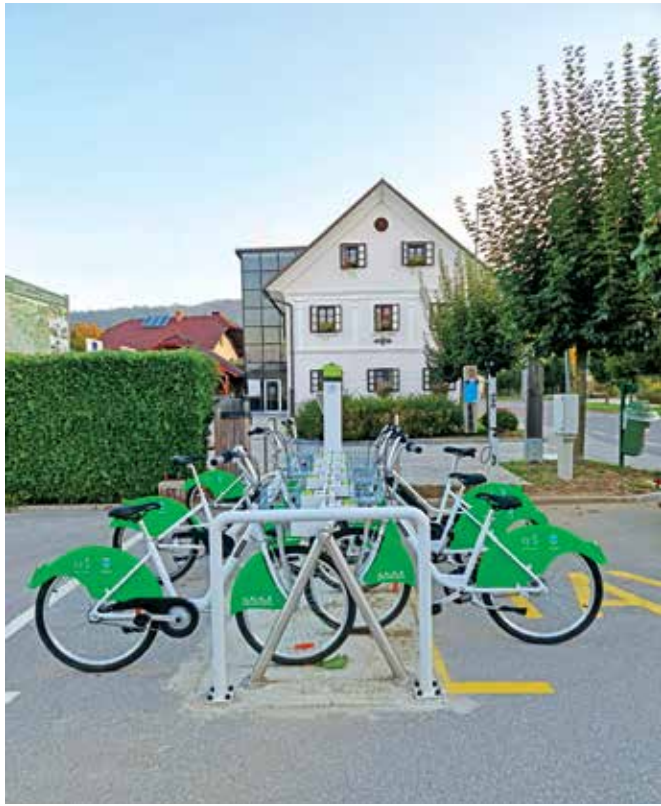
Ena od postaj, kjer si je možno izposoditi kolesa v Cerkljah, je pred Petrovčevo hišo.

Cerklje – Občina Cerklje se je oktobra 2020 pridružila projektu Kolesarska veriga na podeželju, prav pred kratkim pa so vzpostavili tudi dve postaji za avtomatizirano izposajo koles. Ena stoji na parkirišču zraven turistično-informativnega centra pri Petrovčevi hiši v Cerkljah, druga pa je na parkirišču pri nogometnem centru v Velesovem. Sistem, poimenovan Gorenjska.Bike, je enotna rešitev, v katero je poleg Cerkelj vključenih več gorenjskih občin, in sicer Radovljica, Trzin, Naklo, Jesenice, Kranj, Škofja Loka in Bled. Uporaba koles je enostavna. Uporabnik lahko postane vsak, starejši od 14 let. Najprej si izbere kolo in preveri, da je to brezhibno, nato pa preko terminala, s katerim je opremljena vsaka izmed postaj, sledi postopku. Za prijavo v sistem je treba uporabiti