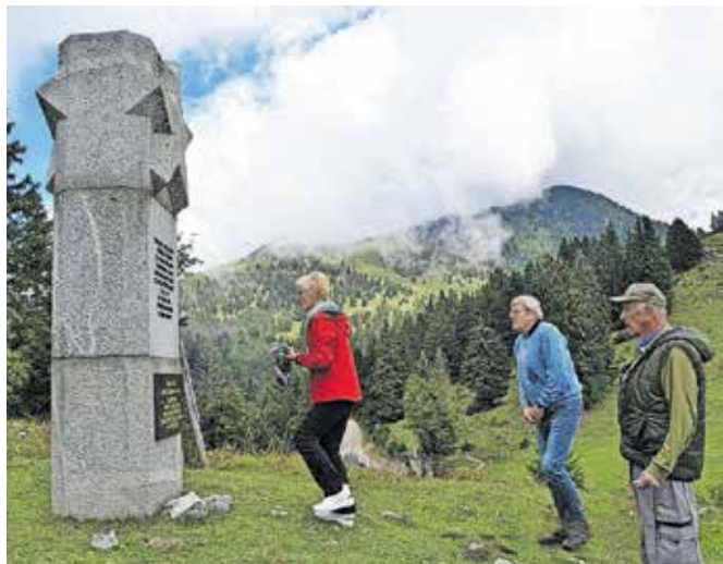
Polaganje venca ob pomniku na Jezercih