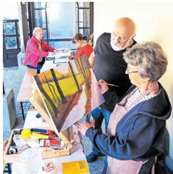
Likovna delavnica v Hribarjevi vili