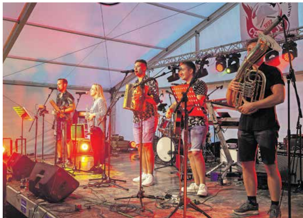
Pestro je bilo tudi večerno dogajanje

V soboto dopoldne se je pred gasilskim domom v Cerkljah zbralo na tradicionalnem