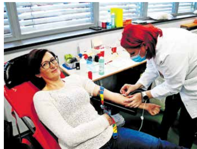
Organizatorji so bili zadovoljni z odzivom krvodajalcev.