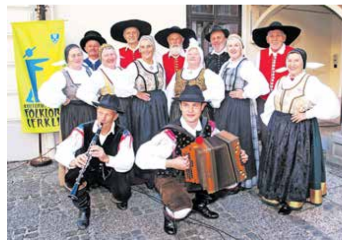
Folklorna skupina iz Cerkelj

Življenjsko zgodbo Ivana Hribarja, rojenega 19. septembra 1851. leta v Trzinu v družini s šestimi otroki, umrlega pa 18.