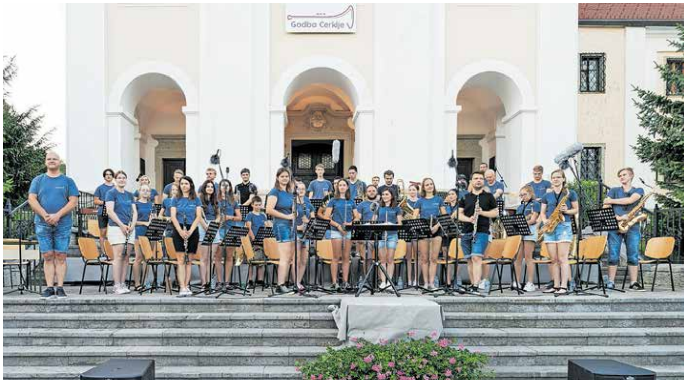
Člani cerkljanske godbe

dijskimi sprejemniki so jih nagradili z bučnim aplavzom. Godbeniki so nato iz radijskih zaplaval med morske valove, jeseni pa zajadrali novim koncer-