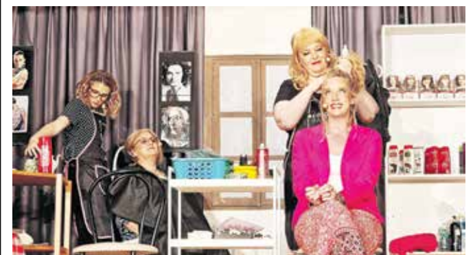
Predstava Jeklene magnolije