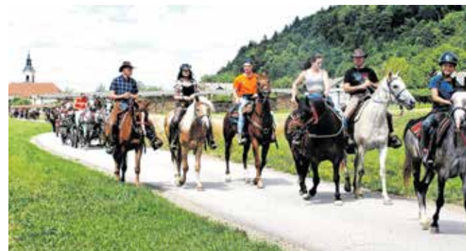
Krvavška konjenica